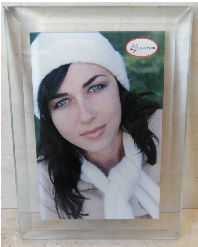
PORTAFOTO IN CRISTALLO ↑